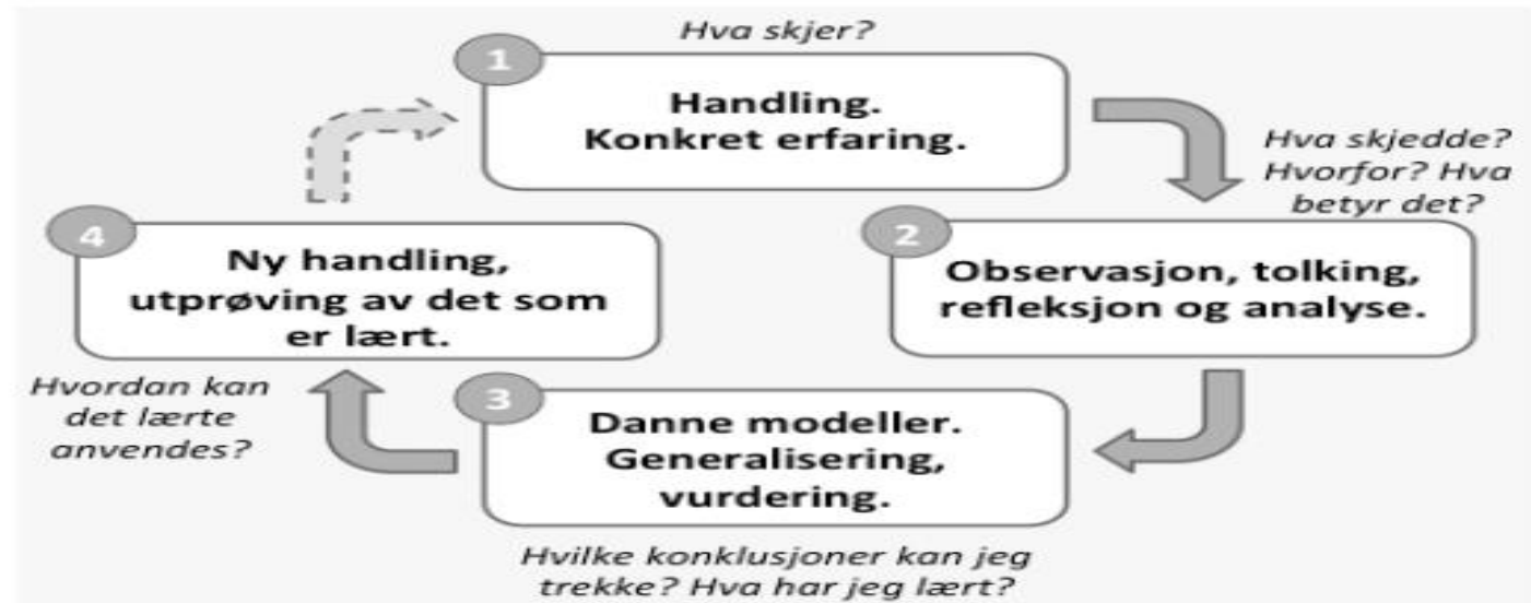
Kolbs eksperimentelle læringsssirke